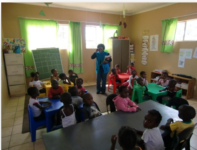
klas in Mmakuanyane

De kinderen in Mmakuanyane hopen dat u en de kinderen van de basisscholen ze niet vergeten en willen helpen.